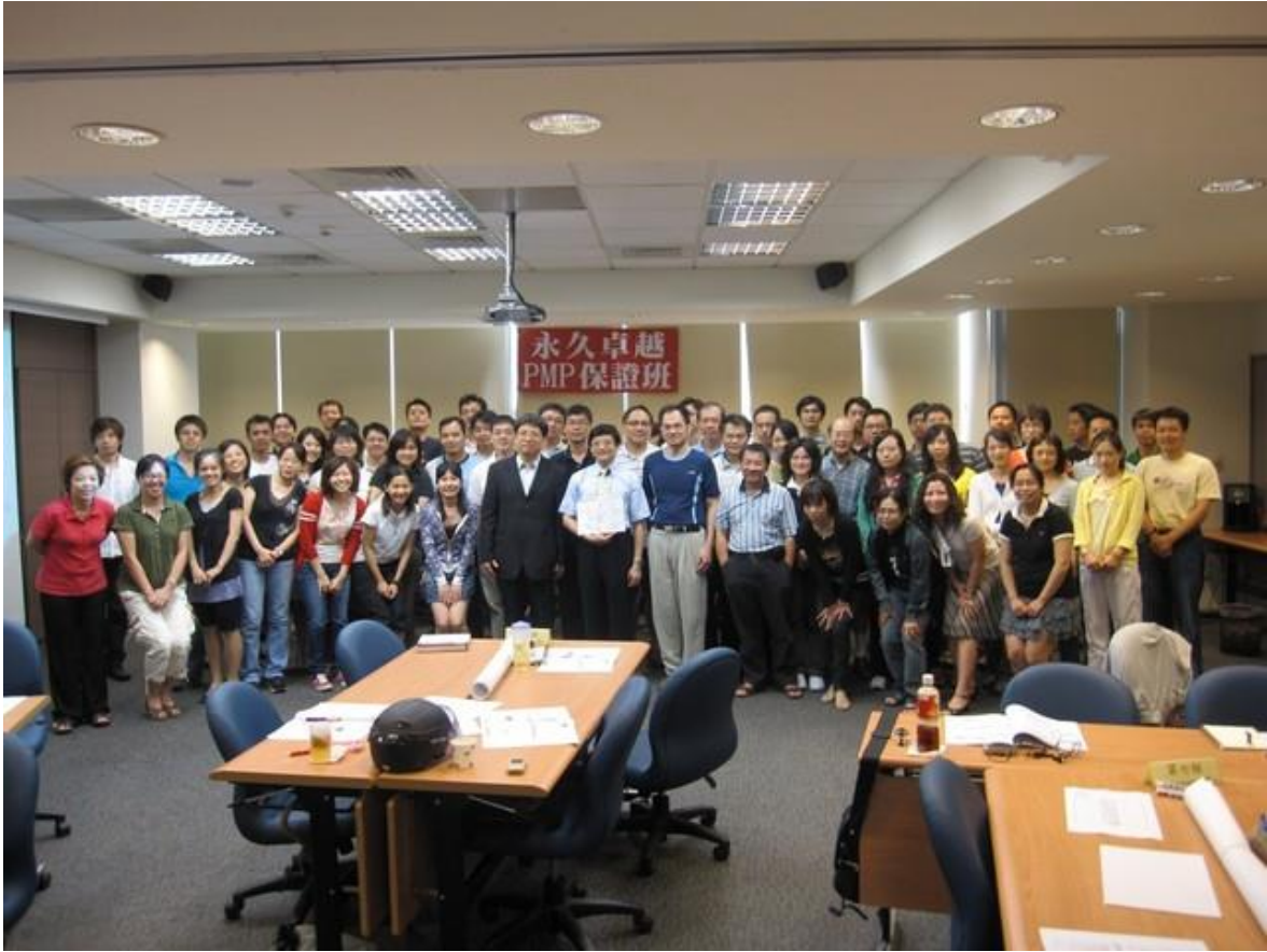
"PMI, CAPM, PMP, PgMP, PMBOK and the REP logo are registered marks of the Project Management Institute, Inc."